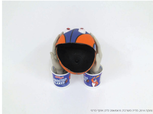
צלקה 2014, סדרה מסורת, סגל אוסיף סרטי